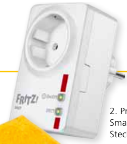
2. Preis: SmartHome Steckdose