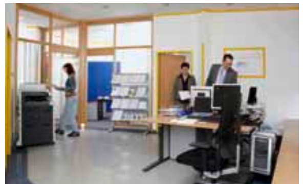
Büroräume am Johanna- Oppenheimer-Platz

Der Beschluss des Aufsichtsrates, nur noch