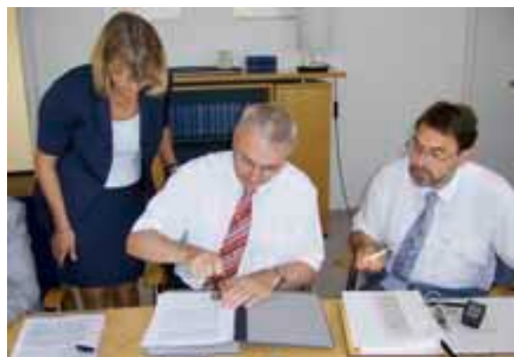
Unterzeichnung des Notarvertrages

Der Münchner Westen war schon immer im Versorgungsgebiet der Isar-Amperwerke AG. Über Konzessionsverträge wurden der Netzbau und der Betrieb des Stromnetzes geregelt. Die Gemeinden Eichenau, Gröbenzell, Olching und Puchheim haben sich bereits 1992 erstmals für eine Kommunalisierung der Netze und die Gründung einer gemeinsamen Netzgesellschaft ausgesprochen. Die Konzessionsverträge wurden harmonisiert und die Laufzeiten auf den 31.01.2005 festgeschrieben. Richtig konkret wurde es aber erst im Sommer 2004. Die Gemeinden haben mit den möglichen Kooperationspartnern erste Sondierungsgespräche geführt. Die Stadtwerke Fürstenfeldbruck und die Stadtwerke Schwäbisch Hall haben ihr Interesse an den Konzessionen und an einer gemeinsamen Kooperationsgesellschaft bekundet. Die Gespräche verliefen aber ergebnislos, was dazu führte, dass die Gespräche mit E.ON Bayern intensiviert wurden. Ab Sommer 2005 wurde Rödl & Partner mit der weiteren Beratung der Verbundgemeinden beauftragt. Das politische Umfeld gestaltete sich alles andere als leicht. Mussten sich doch vier Ge-